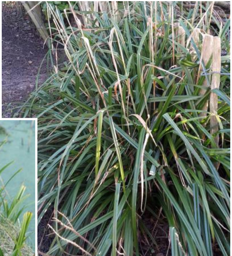
Zegge na vijf jaar