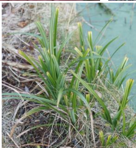
Zegge na twee jaar