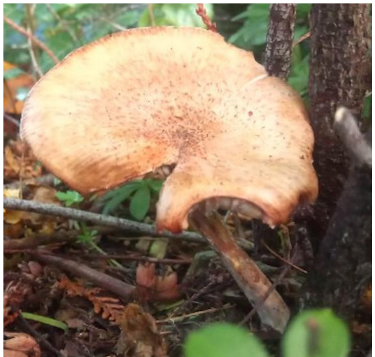
Een Honingzwam aan de Koningsvarenlaan

https://www.tuindingen.nl/blog/bomen/de-honingzwam-gouden-gevaar-voor-je-bomen