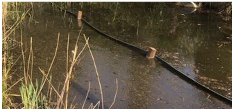
Eendekroosbarrière bij de amfibieoever