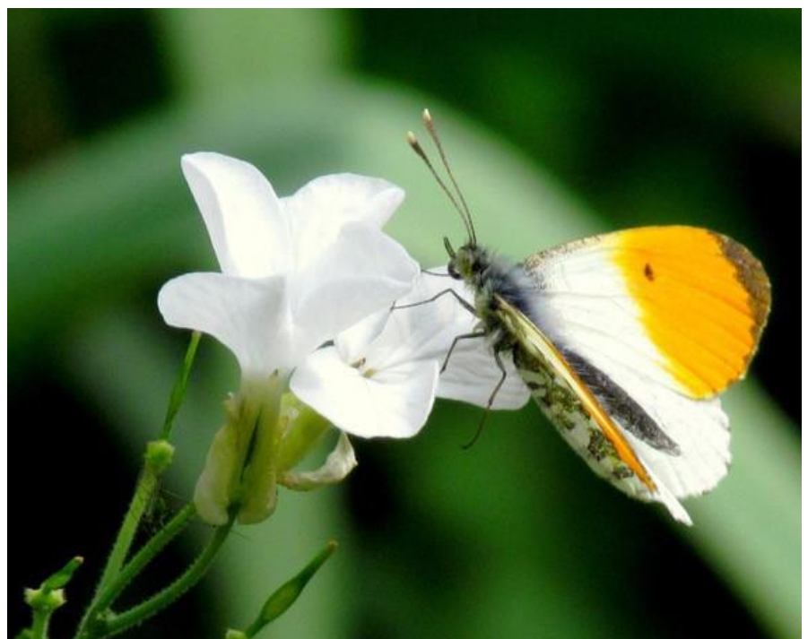
de winnende foto van het Oranjetipje, door: Ans Hobbelink

De prijswinnende foto van het jaar 2020-2021 is gemaakt door Ans Hobbelink. De foto kreeg van alle bezoekers in 't Buitenhuis de meeste stemmen. Ook populair was een foto van de nieuwe geitjes, het was een ware nek-aan-nek race. De winnende foto wordt afgedrukt op canvas en zal een jaar het clubgebouw sieren. Daarna mag de fotograaf hier een andere bestemming voor zoeken. Volgend jaar is er weer een fotowedstrijd. Maak nu alvast jouw foto op landscape formaat. De foto moet een relatie hebben met het tuinenpark en qua kleur en compositie goed passen in de inrichting van 't Buitenhuis.