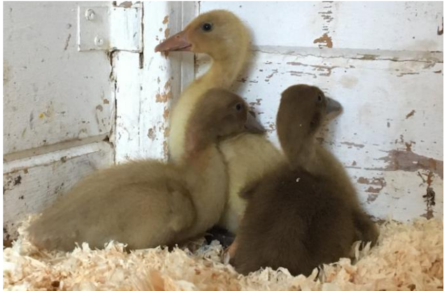
vlnr. Kwek, Kwak, Kwik

Ook onze Orpington eenden zijn inmiddels behoorlijk op leeftijd (8 jaar). In maart leek het er even op dat de woerd (mannetjesceend) erg ziek was en het niet zou gaan halen. Toch is hij weer beter geworden. Onlangs hebben wij drie nieuwe, jonge Orpington eendenkuikens gekocht om de groep weer te versterken. Een mannetje en twee vrouwtjes. Voor de eigen veiligheid zaten ze eerst onder het net naast het kippenhok, maar inmiddels kun je ze zien op een afgezet deel van de weide. Binnenkort zijn ze groot genoeg om de grote weide op te gaan en zich aan te sluiten bij hun oudere soortgenoten.