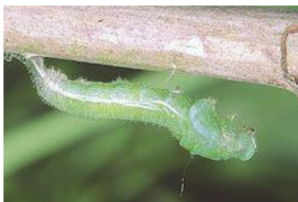
rupes van het Oranjetipje