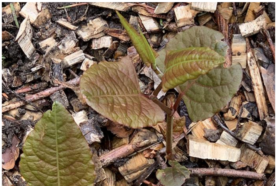
jong blad van de Japanse Duizendknoop

Voor meer informatie over de Japanse duizendknoop zie: