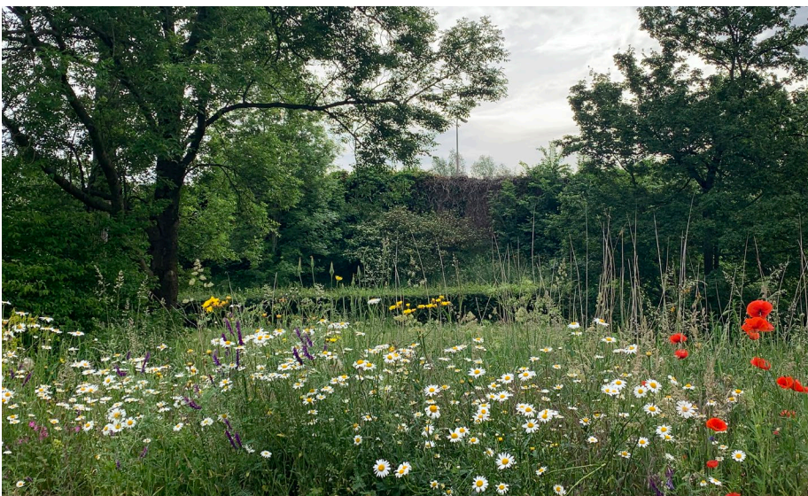
Een bloeiende berm in Voordorp

Nu in de tuinwinkel: CulVita Potgrond Veenvrij 40 liter voor € 6,00