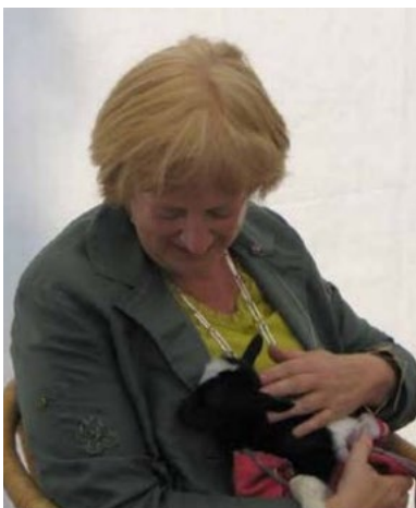
de twee Annie's