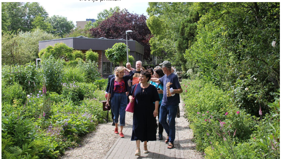
De burgemeester opent de drieparkenwandeling in 2022